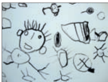
Sabine Dumke, Betreuerin mit Segelschiff